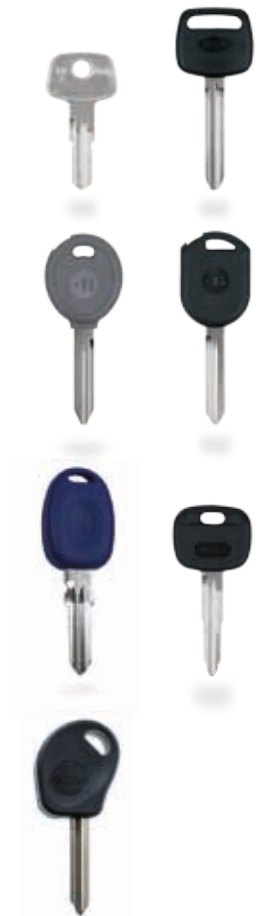
with adaptor с адаптером

More versions for specific markets are available.