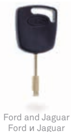
Ford and Jaguar Ford и Jaguar